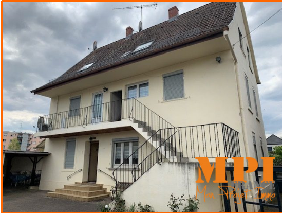
Coup de cœur